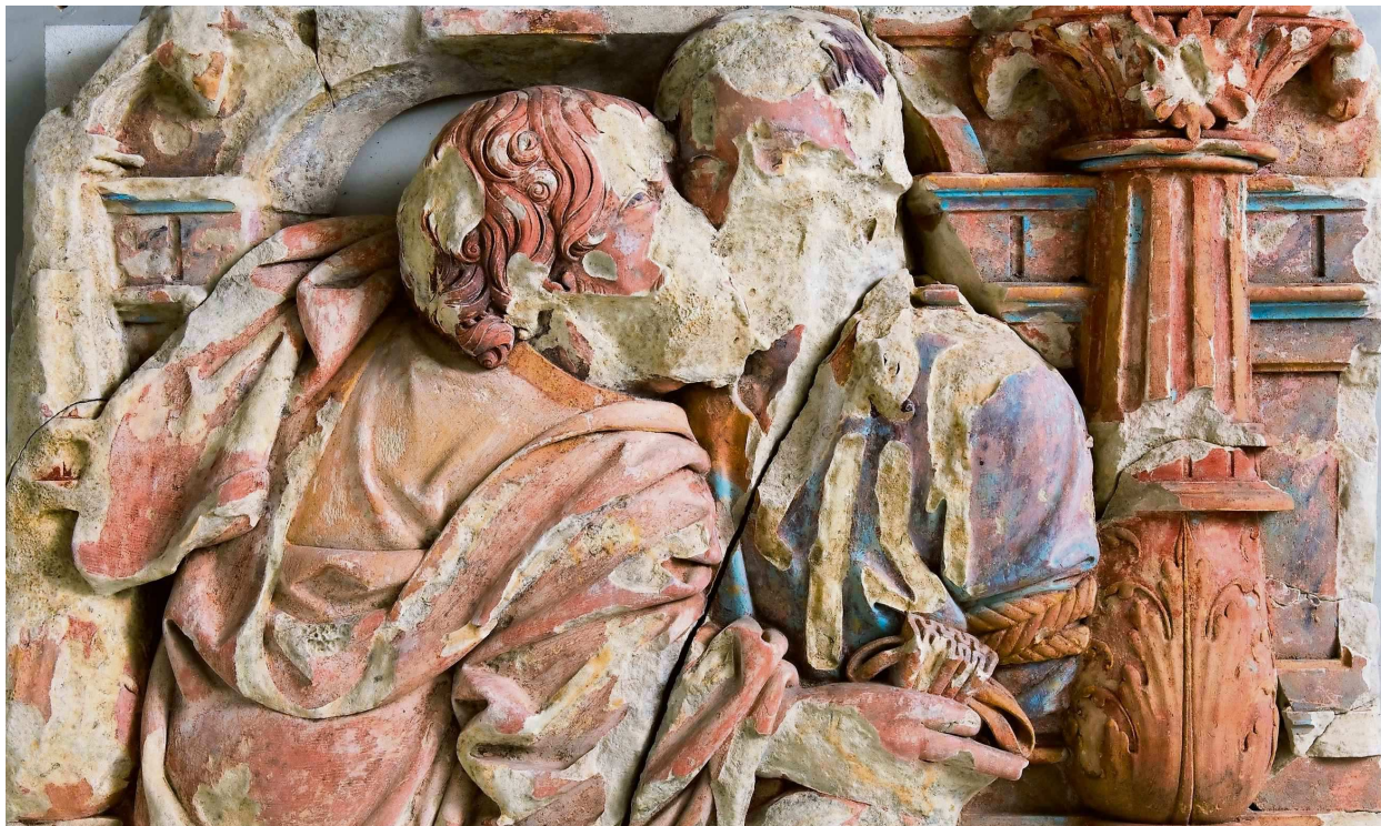
Anoniem, Judaskus, fragment van een monument uit de dorpskerk van Doorn, ca. 1510/1530. Rijksdienst voor het Cultureel Erfgoed, Amersfoort