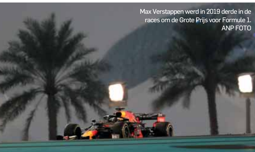
Max Verstappen werd in 2019 derde in de races om de Grote Prijs voor Formule 1.

Terug naar de grote sportevenementen, als vormen van 'het spel' waaraan mensen altijd behoefte houden. Het is helaas al lang niet meer zo, dat voetbal of autoracen geen hoger doel dient. Er staat heel veel 'op het spel': geld. Sporters zijn lopende reclamezuilen geworden. De ernst lees je van hun gezichten af. Juist daarom valt het op, wanneer een voetballer als Frenkie de Jong nog wel glimlacht. Als souvenir van het speelse waarmee het begon.