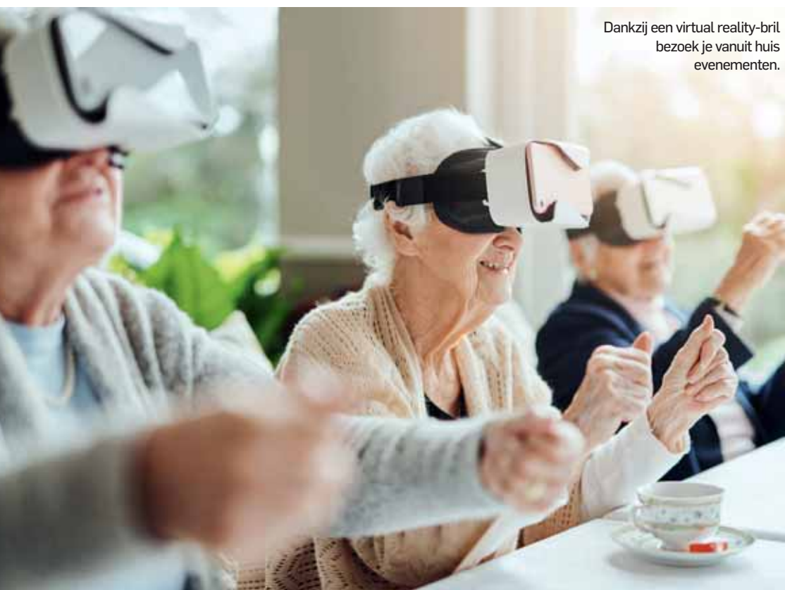
Dankzij een virtual reality-bril bezoek je vanuit huis evenementen.

Nog iets anders: dankzij 4G zijn mensen geobsedeerd geraakt door het scherm van hun smartphone, en met 5G wordt dat niet minder. Het grootste deel van het internetverkeer bestaat uit video. Vanwege de snelheid en stabiliteit waarmee streaming video, zelfs live, op je smartphone te zien zal zijn, neemt het staren naar schermen slechts toe. Dankzij een virtual reality-bril bezoek je straks vanuit huis een festival, dankzij 360°-camera's ter plekke. Hoe moet de mens nog bij zichzelf blijven, met die overvloed aan internetprikkelers? Wat zou schrijver Henry David Thoreau denken van het smartphonetijdperk? Eind negentiende eeuw leefde hij nog in de era van de briefcorrespondentie. Toen al schreef hij: “Hoe minder we contact hebben met ons innerlijk leven, des te vaker en wanhopiger gaan we naar het postkantoor. U kunt ervan op aan dat de arme kerel die (...) met het grootste aantal brieven wegloopt, heel lang niets meer van zichzelf heeft gehoord.”