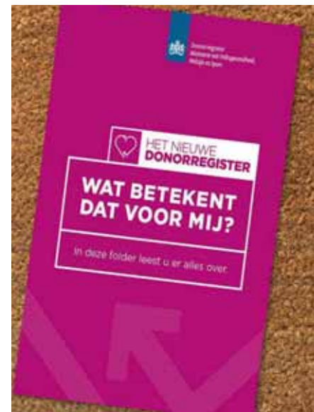
Burgers moeten voor 1 juli 2020 beslissen over het afstaan van organen.

En is het bovendien geen 'administratieve fraude', zoals een hoogleraar dat heeft genoemd, als de overheid vastlegt dat iemand 'geen bezwaar' heeft, terwijl diegene dat niet heeft gezegd? Is dat een leugen, om bestwil?