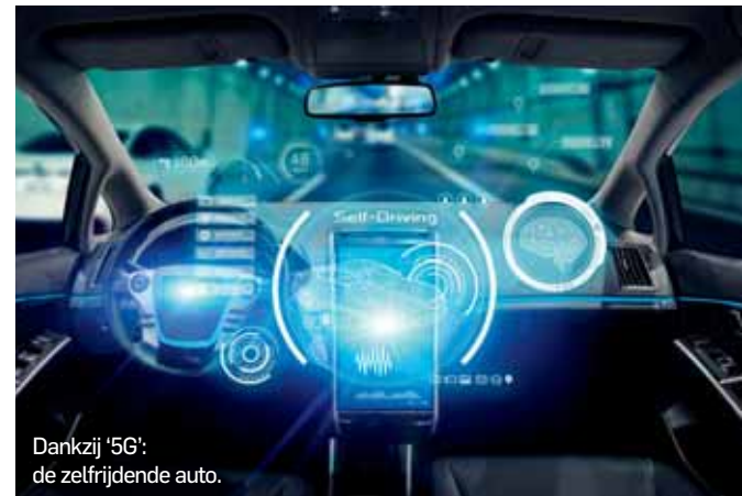
Dankzij '5G': de zelfrijdende auto.

Het mobiele internet 4G heeft ervoor gezorgd dat de smartphone een relikwie is geworden van de vroeg 21ste eeuw. 5G moet nu mogelijk gaan maken dat werkelijk alles om ons heen in een bad van internet wordt gelegd. De reikwijdte wordt duidelijk als je kijkt naar de lijst experimenten die in de 5G-proeftuin in Groningen zijn uitgevoerd, zoals een hoogwaardige beeldverbinding in een ambulance die mogelijk maakt dat een arts vanuit het ziekenhuis meekijkt naar de patiënt; een smart potato die een boer in de akker steekt om de bodemgesteldheid te meten; draadloze sensoren die de grondwaterstand bijhouden; slimme straatverlichting voorzien van camera's; een scheur-sensor die bewegingen in bouwconstructies monitort. Ook is geoefend met autonome binnen-