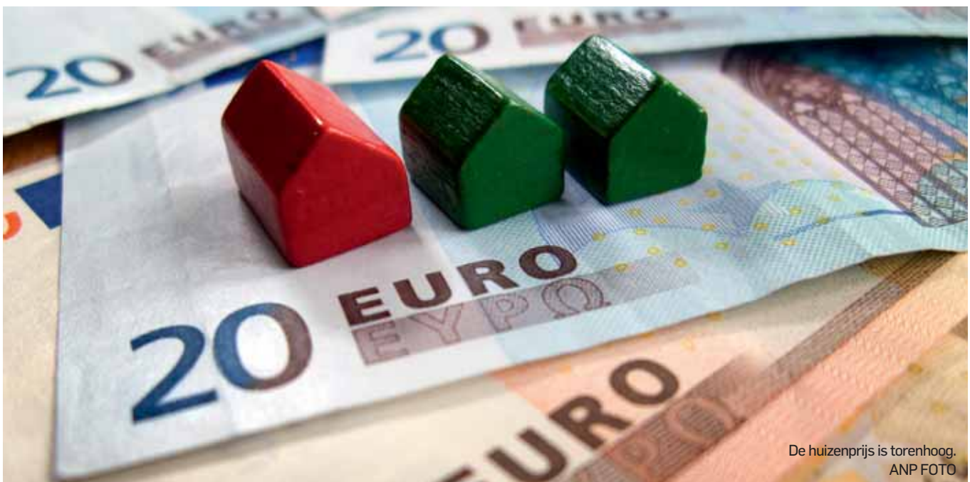
De huizenprijs is torenhoog.

een bepaalde hoeveelheid goud. Dat gaf ons zekerheid, want de Europese munten waren aan de dollarkoers geklonken. Maar sinds 1971 is dat voorbij en is de waarde van ons geld alleen nog gebaseerd op vertrouwen. Bedenk daarbij dat de Europese Centrale Bank, onder het mom van ‘monetaire verruiming’, in een paar jaar tijd ruim € 2.600 miljard in de economie heeft gepompt. Elke euro van die 2.600 miljard is toen letterlijk uit het niets geschapen, met een druk op de knop. Op zo’n grote schaal is dat nooit eerder gebeurd. Maar zelfs nu is het niet klaar: de ECB wil nog meer geld creëren. Hoe kan het dat we tóch het vertrouwen behouden, dat de euro in onze hand iets waard is? “We zijn een terra incognita binnengevaren”, zei Maarten Schinkel, “en we hebben geen idee waar het einde ligt. Het enige wat we kunnen doen, is doorvaren.” En dus varen we door. We snappen de economie weliswaar niet meer, maar kennelijk werkt het. Dat de prijs van het huis waarin we wonen torenhoog is, geeft ook vertrouwen. Maar wat gebeurt er met dat vertrouwen als de huizenprijzen gaan dalen? Of gebeurt er in 2020 wéér niks? ●