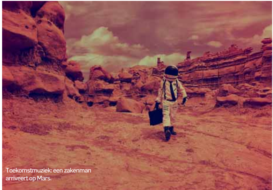
Toekomstmuziek: een zakenman arriveert op Mars.

expedities vertrekken richting Mars: een van de Amerikaanse ruimtevaartorganisatie NASA en een van de Europese tegenhanger ESA (met Russische hulp). In beide gevallen is het de bedoeling dat straks – als de expedities na zo'n zeven, acht maanden zijn aangekomen – een 'rover' over de planeet rijdt die monsters neemt van de grond en het water, en metingen doet in de atmosfeer. Die monsters worden op Mars achtergelaten, zodat ze door een hopelijk latere missie kunnen worden opgehaald. Want zowel de NASA als de ESA wil weten of er op Mars oude sporen zijn van (microbiologisch) leven. Daarnaast willen beide