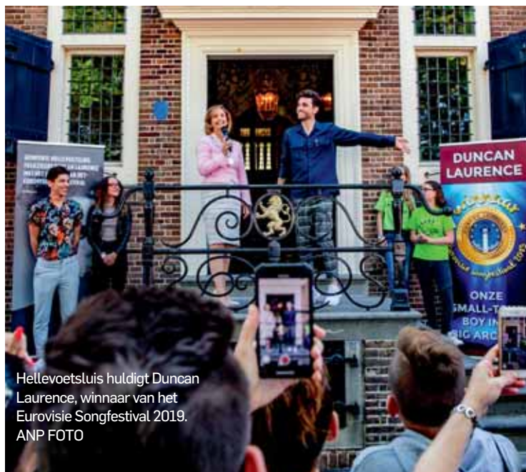
Hellevoetsluis huldigt Duncan Laurence, winnaar van het Eurovisie Songfestival 2019.